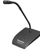
Na gęsiej szyjce